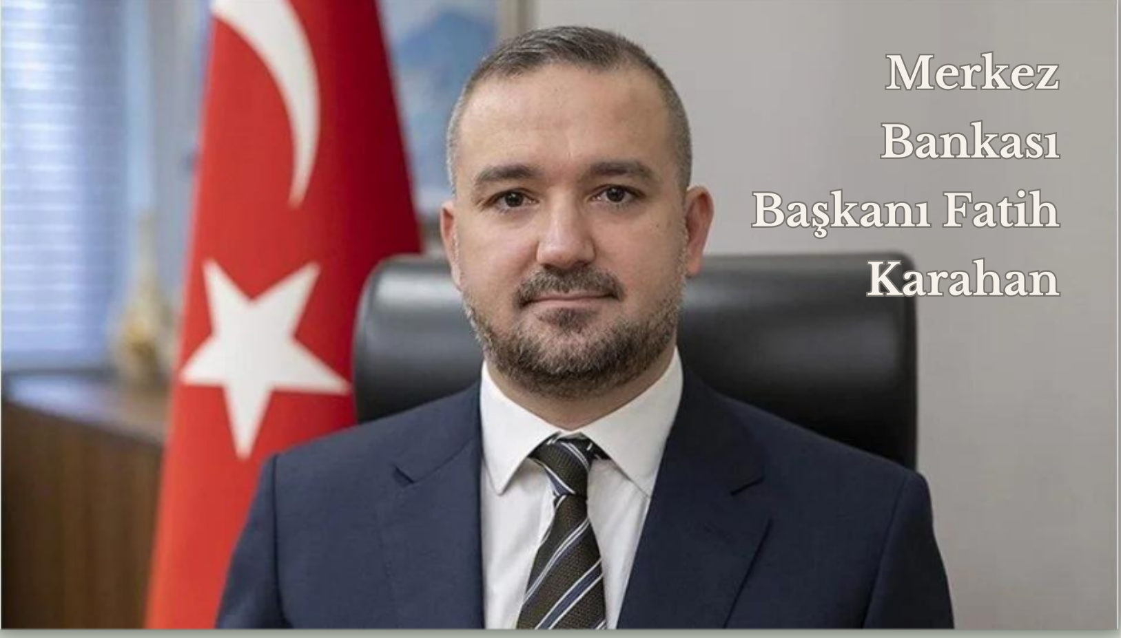
Merkez Bankası Başkanı Fatih Karahana